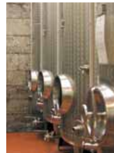
Modernste Technik für edle Weine

Stahltank Edelstahl ist das sauberste Behältnis zur → Weinlagerung , da er sich neutral zum Wein verhält. Edelstahl-Tanks werden häufig für die → Gärung und Lagerung von Weinen verwendet. Vorteile sind die leicht mögliche Reinigung, der völlige Abschluss von Sauerstoff, ein geringer → Schwund und bessere Möglichkeiten der Temperaturregelung.